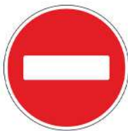
Знак 3.1 «Въезд запрещен»