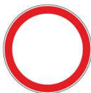
Знак 3.2 «Движение запрещено»