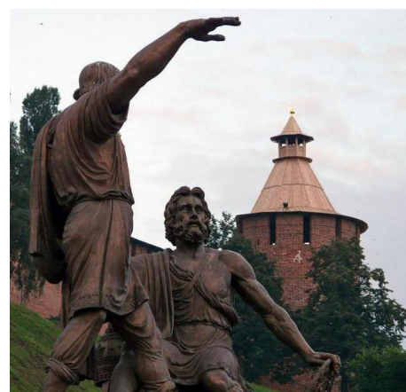
Памятник К.Минину и Д.Пожарскому г.Нижний Новгород

представители всех сословий и национальностей. Этот день важен для множества россиян. Он напоминает о том, что наш бесстрашный народ всегда готов найти в себе как физические, так и духовные силы, чтобы переломить сложившуюся ситуацию.