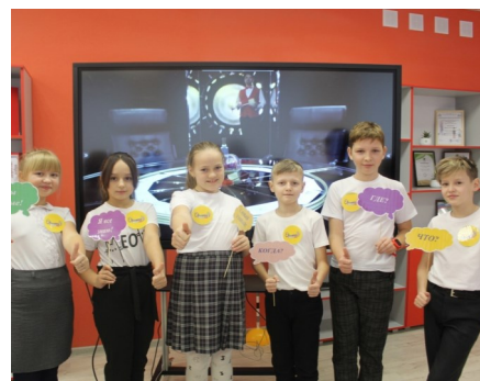
Участники онлайн-игры «Что? Где? Когда?»

тили из 12 вопросов на 7 правильно. Радости не было предела. Ребята зарядились положительными эмоциями и наполнили свой багаж знаний.